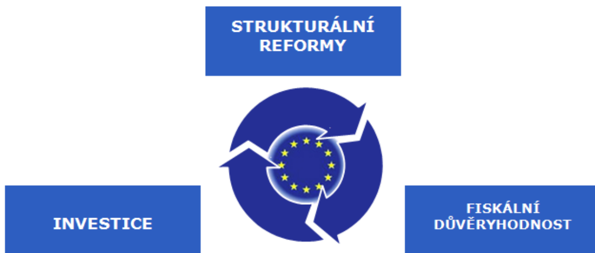
Graf č. 1: Integrovaný přístup

Pro znovunastolení důvěry, snížení nejistoty, která brání investicím, a maximální využití vzájemného a současného působení všech tří pilířů je zásadní simultánní akce ve všech třech oblastech. Zejména je zřejmé, že pro udržitelnost veřejných financí a pro uvolnění investic bude zásadní obnovený závazek ke strukturálním reformám.